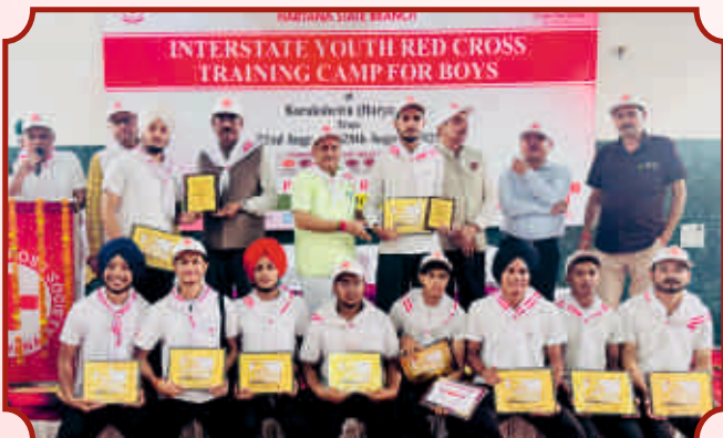
ਰੈਡ ਕਰਾਸ ਕੈਂਪ