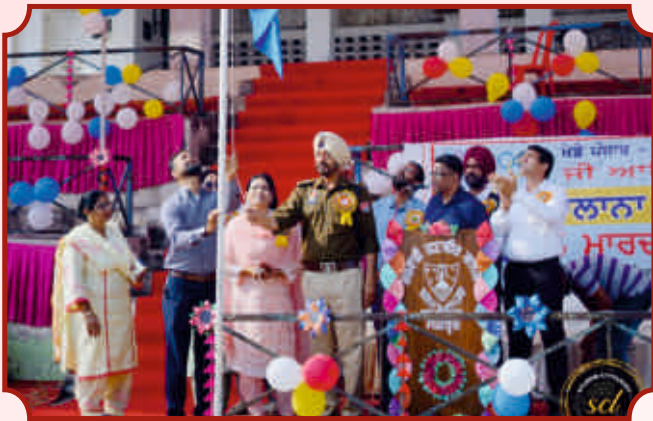
ਸਾਲਾਨਾ ਖੇਡ ਸਮਾਰੋਹ