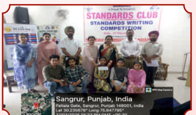
ਸਟੈਂਡਰਡ ਕਲੱਬ ਦੇ ਜੇਤੂ ਵਿਦਿਆਰਥੀ