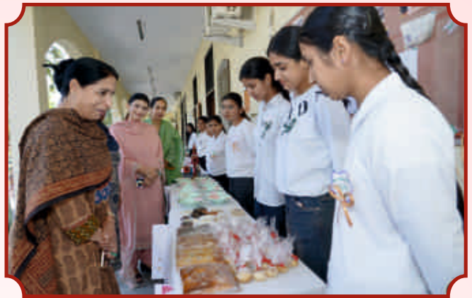
NSS ਯੂਨਿਟ 4 ਵੱਲੋਂ ਪ੍ਰਦਰਸ਼ਨੀ