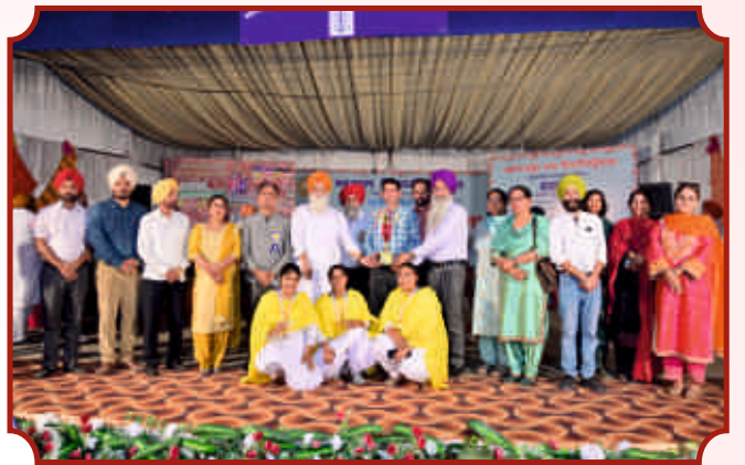
ਜ਼ੋਨਲ ਯੁਵਕ ਮੇਲੇ ਦੀ ਜੇਤੂ ਟੀਮ