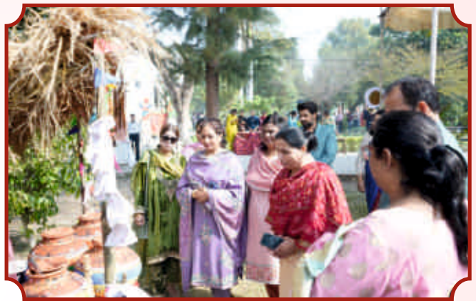
Home Science ਵਿਭਾਗ ਵੱਲੋਂ ਪ੍ਰਦਰਸ਼ਨੀ