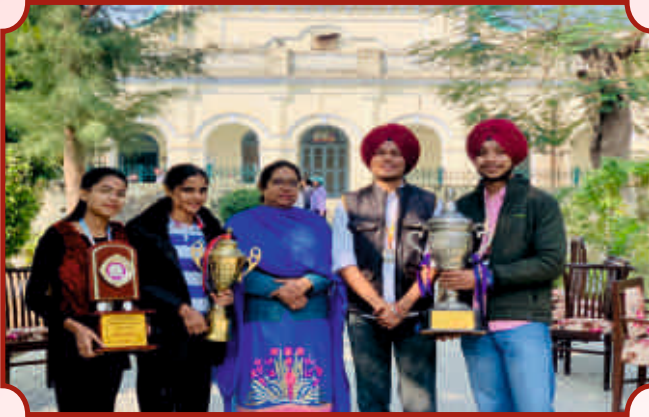
ਅੰਤਰ ਜ਼ੋਨਲ ਯੁਵਕ ਮੇਲੇ ਦੀ ਜੇਤੂ ਟੀਮ