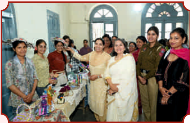
Best out of Waste ਵੱਲੋਂ ਪ੍ਰਦਰਸ਼ਨੀ