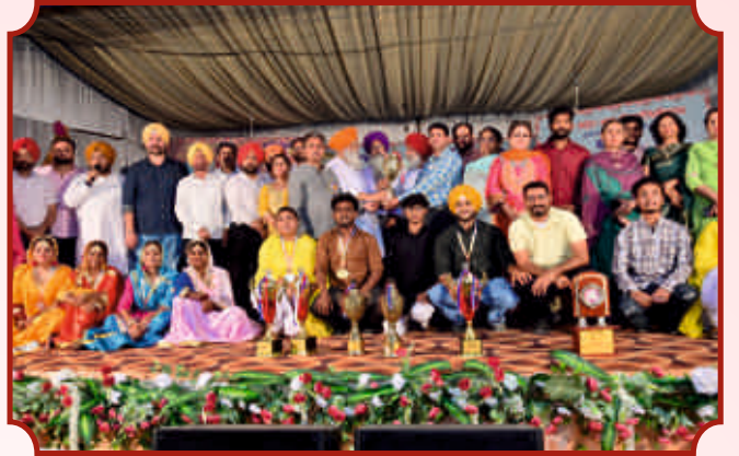
ਜ਼ੋਨਲ ਯੁਵਕ ਮੇਲੇ ਦੀਆਂ ਜੇਤੂ ਟੀਮਾਂ