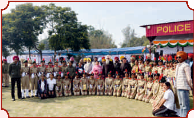
ਐੱਨ.ਸੀ.ਸੀ. ਕੈਂਡਿਡ ਲੜਕੀਆਂ