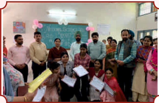
ਨੈਸ਼ਨਲ ਸਾਇੰਸ ਦਿਵਸ ਮੁਕਾਬਲੇ ਦੇ ਜੇਤੂ