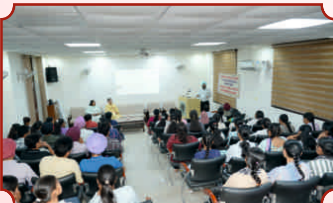
ਪਲੇਸਮੈਂਟ ਸੈਲ ਦੁਆਰਾ ਆਯੋਜਿਤ ਲੈਕਚਰ