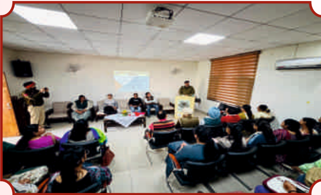
ਆਈ. ਆਈ. ਸੀ. ਦੁਆਰਾ ਆਯੋਜਿਤ ਮੋਟੀਵੇਸ਼ਨਲ ਲੈਕਚਰ