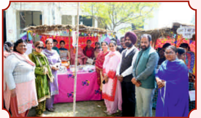
ਹੋਸਪਿਟੈਲਿਟੀ ਵਿਭਾਗ ਵਲੋਂ ਆਯੋਜਿਤ ਪ੍ਰਦਰਸ਼ਨੀ