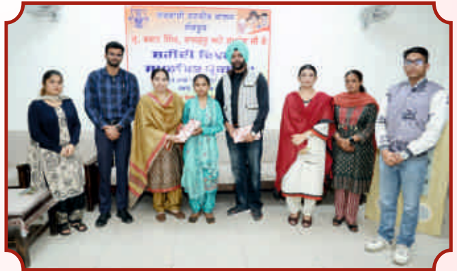
ਰਾਜਨੀਤੀ ਸ਼ਾਸਤਰ ਵਿਭਾਗ ਵੱਲੋਂ ਸ਼ਹੀਦੀ ਦਿਵਸ ਤੇ ਸੈਮੀਨਾਰ